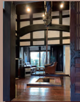
出村ギャラリー 囲炉裏の間